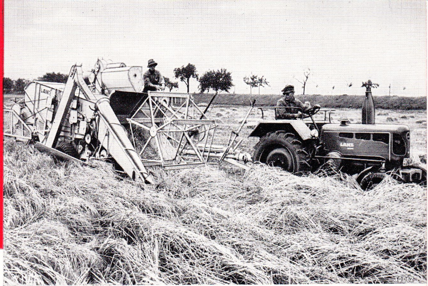
Der 24 PS LANZ-Bulldog-Diesel und der LANZ-Mähdrescher MD 14 Z, ein ideales Gespann für die Getreideernte im bäuerlichen Betrieb.